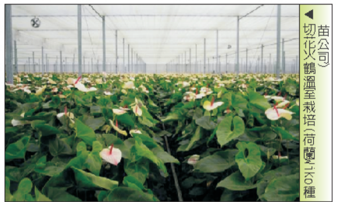
▲切花火鶴溫室栽培(荷蘭Tjoko種苗公司)

荷蘭為世界上最大的花卉生產和出口國，素有「歐洲花園」的美譽，花卉品種已超過11,000個，其中以鬱金香最為聞名，其培育的鬱金香品種約700種，遠銷100多個國家和地區。這幾年荷蘭也開始面臨中南美洲及非洲國家的低工資競爭壓力，在荷蘭市集或大賣場皆可買到5把5歐元的進口玫瑰花，花色極為豐富，還贈送切花保鮮液及使用說明，雖然增加少許成本，但大大提高附加價值。