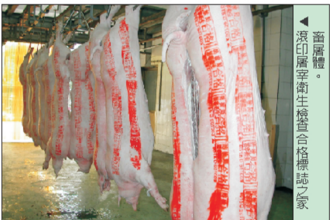
▲畜屠體。滾印屠宰衛生檢查合格標誌之家

豬肉是國人最常食用的肉類，每人每年平均消費肉品總量約 77公斤，其中豬肉約占40公斤，居所有肉類之冠。因此，選擇衛生、安全的豬肉成為家庭主婦最常面對的課題。到底要如何選購優質又衛生安全的肉類，其實是有竅門的。大致來說，可從肉品之色澤、彈性及標示或合格的戳章予以判斷。亦即要選購表面有光澤、肉質富有彈性而且聞起來沒有異味的肉，觸摸時豬肉表面粗粗的，就是新鮮的豬肉，消費者都可以透過眼觀、鼻聞、手觸來選擇良好的生鮮肉品。