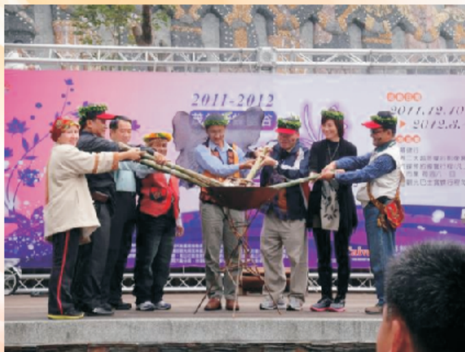
▲貴賓參與活動開幕祈福儀式

位處茂林國家風景區內之高雄市茂林區屬山地鄉，為全世界著名的越冬型紫斑蝶棲息地，與墨西哥「帝王斑蝶谷」並列為目前世界兩大規模「越冬型蝴蝶谷」同屬世界級的自然資產，一年一度的紫斑蝶遷徙生態景象，加上茂林區魯凱文化特色的萬山岩雕及黑米祭活動，每年此時總會吸引上萬名的遊客來到此地參觀，莫拉克風災的侵襲後，行政院