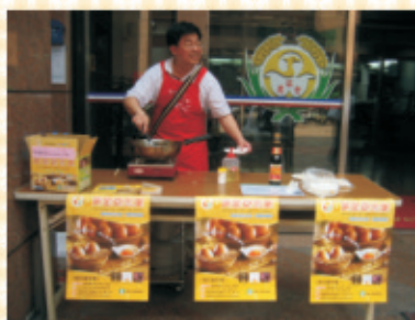
▲本會信用部熱點推銷黃金養生蛋試吃活動，吃過民眾非常踴躍且都稱讚好吃。

【本刊訊】本會門市推出由超夯黃金養生蛋禮盒包裝，由於口感美味健康，是熱門商品之一，現正熱賣中。黃金養生蛋每週不定期直送至本會門市，請欲購買之民眾直接訂購，黃金養生蛋一盒約4台斤±3%，目前售價230元整，歡迎訂購(門市電話07-7463131#296)