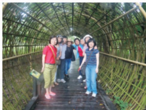
▲新威森林公園裡有夢想中的時光隧道，讓想追回18歲時光的美少女風姿夢想成真。

102年度自強活動出團了！我們期盼已久的自由行，在千呼萬喚中終於敲定日期7月25、26日，當日起程決不延遲「宣誓聲中定案。「時刻已到立即發車，未到旅客請自行搭車前往」領隊發令，車子也不遲疑發動，結果大伙都準點報到。首站永齡杉林有機農業園區，當日適逢園區辦理「感動心科技、幸福新經濟」的農業活動，本團躬逢其會除參觀有機農特產品及生產區外，另一個重頭戲就是參觀高科技產業—設施農業及植物生長箱，此農金產業係將農業結合新科技跨足各種不同領域及方法，呈現設施化生產新樣態，在有限的資源與條件下，落實科技於實際