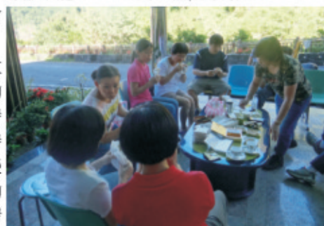
▲大門前玄關享用早餐、品茗、閒聊話家常，加上大自然氛圍真的很棒，有金鑽VIP的感覺喔。