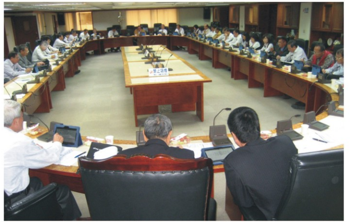
▲理事會人手一機的平版開會場景

歐總幹事為顧及理、監事們使用平版困擾，特別指示會務股及資訊室相關同仁，提供使用平版電腦問題