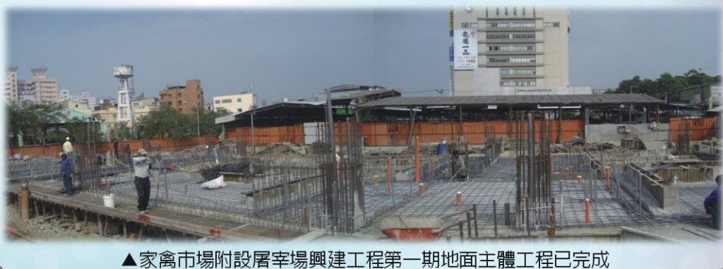
▲家禽市場附設屠宰場興建工程第一期地面主體工程已完成

本工程將設置合法屠宰線4線，先期安裝機械設備3線，視營運需求，再擴充為4線，並依法設置屠宰設備，規劃車輛、交通動線及水電、消防、污水處理等設施，為禽肉安全衛生把關，符合現代化家禽批發市場及地區禽肉消費主要市場，是本場未來發展之目標。