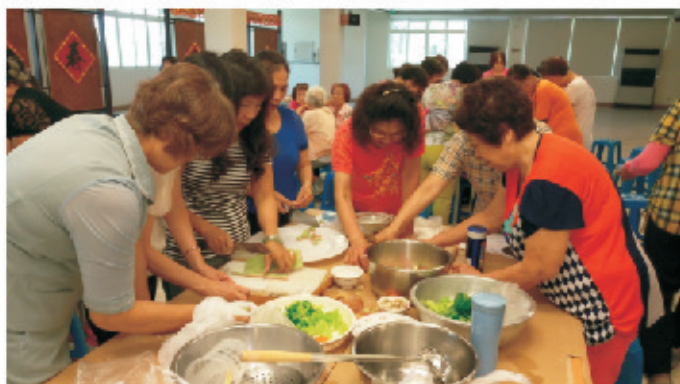
▲班員們用心學習製作及調理在地生產的農產品。

為配合政府推動「食在地、享當季」之政策，鼓勵消費者支持臺灣在地優質農產品，並結合健康為主軸，用在地優質農產品入菜的食材，本會於4月份起假本會供銷部二樓家政烹飪教室，舉辦一系列「食在地、享當