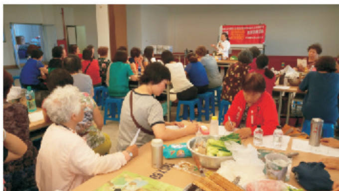
▲講師熱情講授每樣美味可口食材。