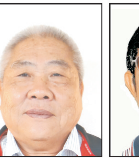
鎮南五福 楊代表發富