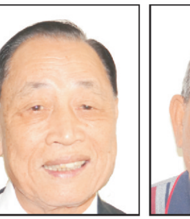
老爺新甲 吳代表寶致