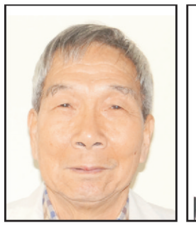
老爺新甲 黃代表家松