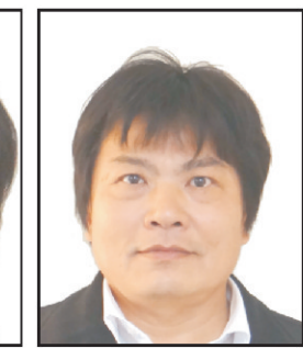
鎮北北門 余代表惠專