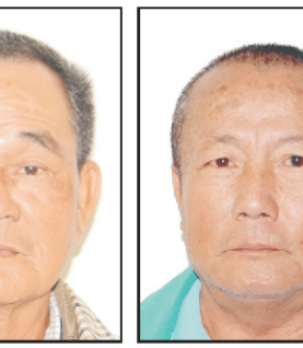
老爺新甲 柯代表榮輝