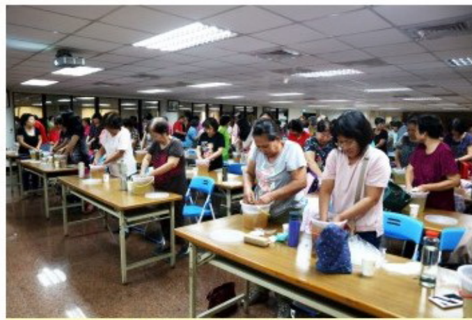
▲班員們遵循講師方法，認真的搓洗愛玉。