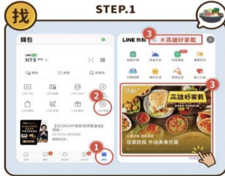
▲進入「高雄好家載專區」步驟。