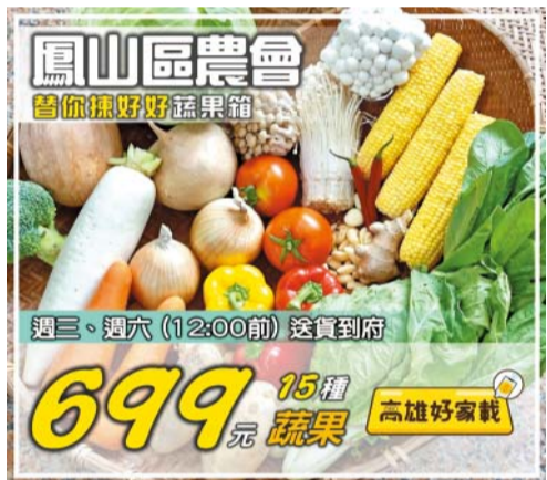
▲高雄市府攜鳳山區農會推出「揀好蔬果箱」，高雄地區內20公里免運送到家。

蔬果箱下單的使用方式結合台灣最常用的LINE通訊軟體，只要打開後點選右下角的「錢包」，點選「LINE熱點」就可搜尋到「高雄好家載」專區。進入後，搜尋「鳳山區農會」，就可買到「揀好蔬果箱」。該專案線上結帳只能使用LINE Pay。