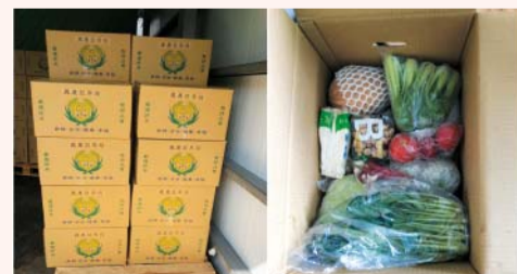
▲開箱! 本會蔬果箱，蔬菜與水果都各自用塑膠袋包裝。

6月30日當天約在8時50分至9時10分完成蔬果箱搬上計程車車廂，一輛輛計程車陸續出發，接著就是按訂單地址趕緊將蔬果箱宅配到府。此次有購買「揀好蔬果箱」的民衆也於當天在line熱點上留言「送貨前一天還會電話確認，今天早上收到，覺得很超值。」、「當天送貨司機大哥也會做確認，服務很好，看到一整顆高麗菜和大南瓜，好開心，謝謝你們。」