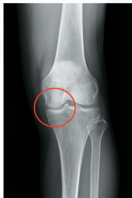
▲(圖1) X光可見膝蓋內側間隙較狹窄表示軟骨磨損。

的消炎止痛藥，針劑常見的有止痛針、玻尿酸、自體高濃度血小板(PRP)到近年來最新的羊膜/絨毛膜萃取物，手術方面也是從根據不同的分級，早期退化可接受關節鏡微創清創(圖二)，0型腿可接受截骨矯正手術，嚴重退化可接受全人工膝關節置換或是最新的牛津半人工膝關節置換。