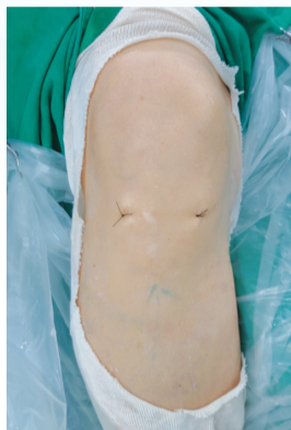
▲(圖2) 關節鏡微創手術，只有兩個各一公分長的傷口。