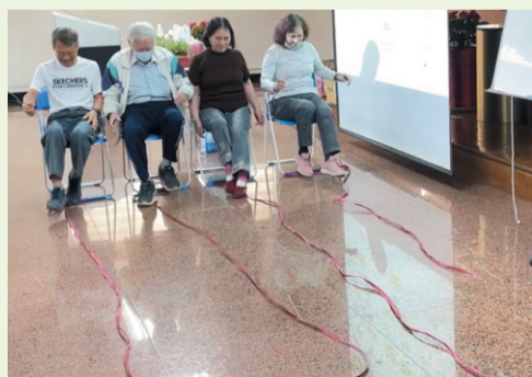
▲深受團員好評的團康遊戲，比賽誰可以用腳最快收好繩子。

課堂中也同時為長者設計有益身心健康的團康遊戲，像是賓果遊戲、比賽誰可以人坐在椅子上並用腳快速收回放在地上的繩子，只見長者們非常投入遊戲，並於笑鬧中達到協助他們紓壓及放鬆之目的。