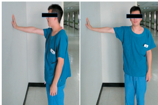
▲(圖一左)手從前方爬牆壁的復健動作。 ▲(圖一右)手從側面爬牆壁的復健動作。

沾黏性關節囊炎也就是俗稱的五十肩，早期的症狀是手摸不到背後，女性要伸手到背後穿內衣會有困難，慢慢的手會舉不高，連要拿放高一點的東西都拿不到。五十肩是關節囊的嚴重沾黏增生，而非正常的肌腱韌帶受損，所以治療上以非手術治療為主，包含吃消炎藥、打針以及復健治療，復健治療著重於肩部活動度的恢復，在家中也可以做，如圖一所示，手摸著牆壁沿著牆壁向上爬以達到伸展的目的，爬牆壁的方向分成前方和側邊，目標為回復活動度