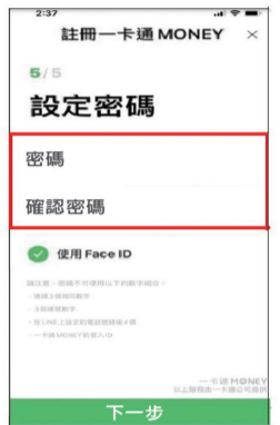
設定密碼 完成註冊