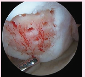
▲(圖二)關節鏡下對於軟骨缺損處進行鑽洞。