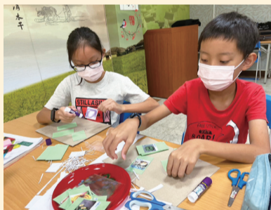
▲這份互動遊戲的配件完手工製作，皆由會員及義指分工合作之下努力完成的。

本會推廣部於今(112)年11月5日，辦理從本次食農教育互動桌遊體驗活動，瞭解在這個嶄新的教育趨勢中，如何讓孩子啟動自主學習能力，亦能暫時遠離科技的冷漠，進而凝聚家庭親子關係。因此由幸福人創意桌遊—吳立珩老師的帶領下，透過桌遊的教學，引發孩子們自主學習的熱情產生，更藉由桌上遊戲的方式，體驗感受到「自發、互動、共好」是一個重要的學習核心理念。