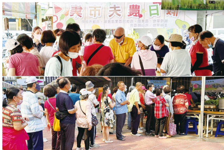
▲農夫市集裡還有食農教育手洗愛玉活動。