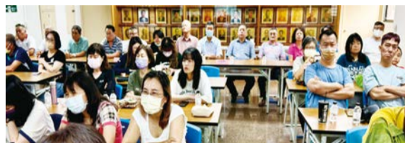
▲本會全體理、監事、總幹事、員工們上課情況一隅。

防制洗錢的意識與作法也必須與時俱進。期望該次參與教育訓練的同仁們能學習到正確觀念並落實執行，有效做第一線的把關，以因應各項業務的洗錢防制挑戰。