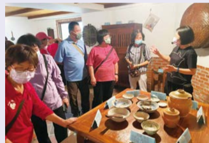
▲本會農村文物館內一景。

驗教育，希望能幫助學員認識食物的原型樣貌，也可以具備簡單的農事技能及烹飪能力，以建立良好的飲食習慣。食農教育法以地區農業特色連結在地資源，提供農業生產及國產農產品相關消費資訊及辦理相關課程，推動地產地消，珍惜食材不浪費，達成農村永續發展。