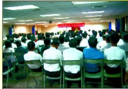
▲全體員工專注參與研討

三項急切性議題，低利率、合理評估及加強服務訓練。本次體質改善小組也針對此急迫性議題提出改善方案，希望由大家所凝聚共識，共同備生討論出方案，大家應齊心向前共同支持，為農會永續經營，員工全力以赴創未來。